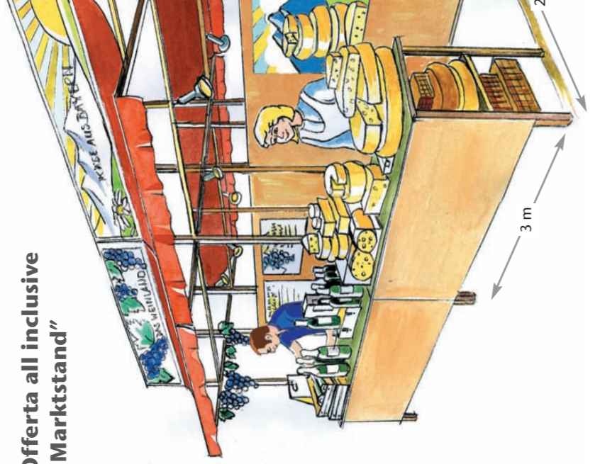
Abbildung ist nicht verbindlich. L'Illustrazione è indicativa.