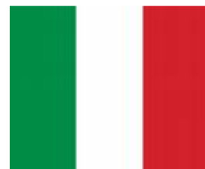
Illustrazione del progetto COLLETTIVA EXPO REAL ITALY

EXPO REAL 2010 13° Salone Internazionale del Real Estate e degli Investimenti Immobiliari 4 – 6 ottobre 2010 Monaco di Baviera